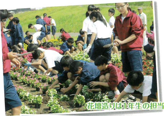
花壇造りは1年生の担当

昨年6月、今年度も酒田三中のマコモ植栽ボランティアが最上川スワンパーク周辺で行われました。三中より388名の生徒が参加し、ハクチョウのエサとなる「マコモ」の移植作業や花壇の定植・公園の清掃を行いました。本校では平成6年に参加して以