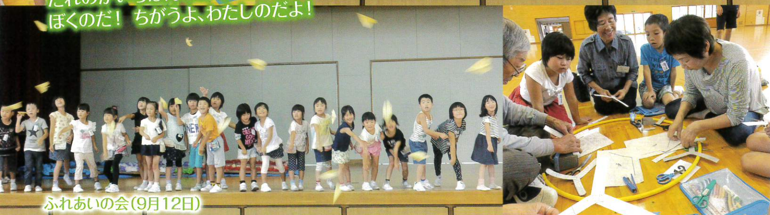
ふれあいの会(9月12日)

亀ヶ崎コミセン建設が動き出しました。地域住民のそして各方面の皆さんの建設に対する情熱が実を結びつつあります。この亀ヶ崎コミセンの建設は地域の全世代の活動に、大きなインパクトになると期待されています。 地域福祉を担う役割を課せられた私たち社会福祉協議会のメンバーも、従来の考え方もっと発展させた新しい視点に立った活動を計画しています。 ① 拠点型の健康生活を志向した活動 ② 地域全体の訪問型の見守り活動 ③ 地域交流と孤立を防止するサロン活動 このような活動を通じて、いきいきとした地域をかたち造っていくことが私たちのそして、それに積極的に参加していく地域住民の皆さんの役割であると思えます。 さあ、新しい時代へ。希望を持って…。