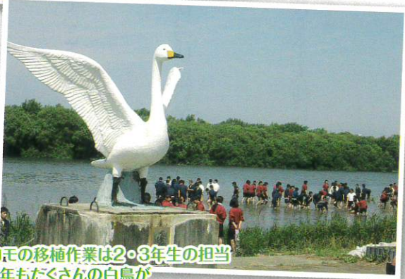
マコモの移植作業は2・3年生の担当「今年もたくさん白鳥が飛んで来てくれますように!」

来、長年にわたり継続的に行われてきた伝統行事です。生徒たちは飛来したハクチョウの多くが羽を休める最上川の浅瀬に素足で入り、株分けした根っこを泥だらけになりながら次々植えていきました。平年より雪が多く、寒い冬になった今年、酒田を訪れていたハクチョウたちの北帰行が始まりました。長い旅を無事に終え、来年も元気な姿を見せてほしいと願っています。