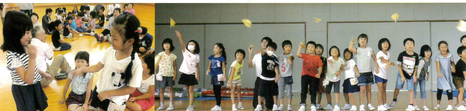
だれのがいちばんとおくへとんだ？ ぼくのだ！ちがうよ、わたしのだよ！