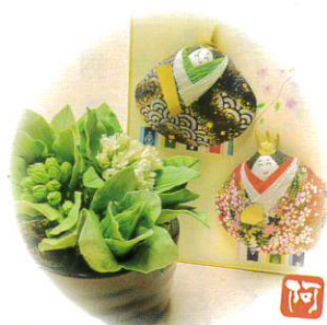
パンフラーのふきのとうと、貝雛